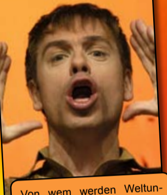
„Von wem werden Weltuntergänge vorhergesagt? Von Männern. Männer erinnern sich nicht mal an ihren Hochzeitstag – wissen aber genau, wann die Welt untergeht!“ Michael Mittermeier Mi 21 Okt 20:00 LANXESS arena