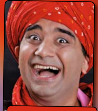
„Der gemeinsame Nenner – sie sind alle Menschen mit Migränegrund.“ Doppelte Spaßbürgerschaft Do 22 + Fr 23 Okt 20:00 Bühne der Kulturen im Arkadas Theater