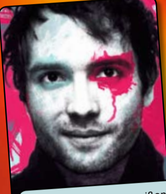
„Wenn alle Stricke reißen, kann man sich nicht mal mehr aufhängen.“ Marc-Uwe Kling So 18 Okt 20:00 Comedia Theater