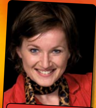
„Ich bin ja ganz froh, wenn wir uns mal streiten. Erfahren wir wenigstens was voneinander. Sonst sagt er ja nix.“ CAVEWOMAN Fr 16 Okt 19:30 Gloria Theater