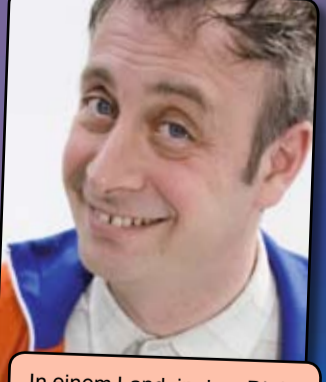
„In einem Land, in dem Dieter Bohlen, Oliver Kahn und Eva Herrmann Bücher schreiben – muss man da wirklich noch lesen lernen?“ ALFONS Do 29 Okt 20:15 Senftöpfchen-Theater