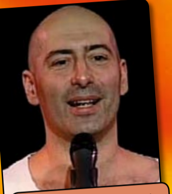
„Wie lang muss ein Huhn durch den Wald laufen bis es ein Fuchs wird?“ FIL Mo 19 + Di 20 Okt 20:30 Comedia Theater