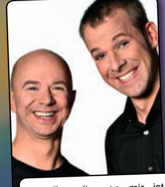
„Ne Freundin von mir ist Gestalttherapeutin. Da kannst Du mit Pferden schwimmen, die denken, sie seien ein Delphin.“ Helge und das Udo Mi 28 Okt + Do 29 Okt 20:30 Klüngelpütz