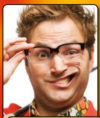
„Rrrichtig!“ Paul Panzer Fr 16 + Sa 17 Okt 20:00 E-Werk