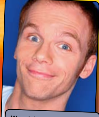
„Wer viel zu sagen hat, muss einfach schneller reden!“ Ralf Schmitz So 25 Okt 19:00 Theater am Tanzbrunnen