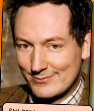
„Shit happens – mal bist du die Taube, mal bist du das Denkmal!“ Dr. med. Eckart von Hirschhausen Do 22 Okt 20:00 LANXESS arena